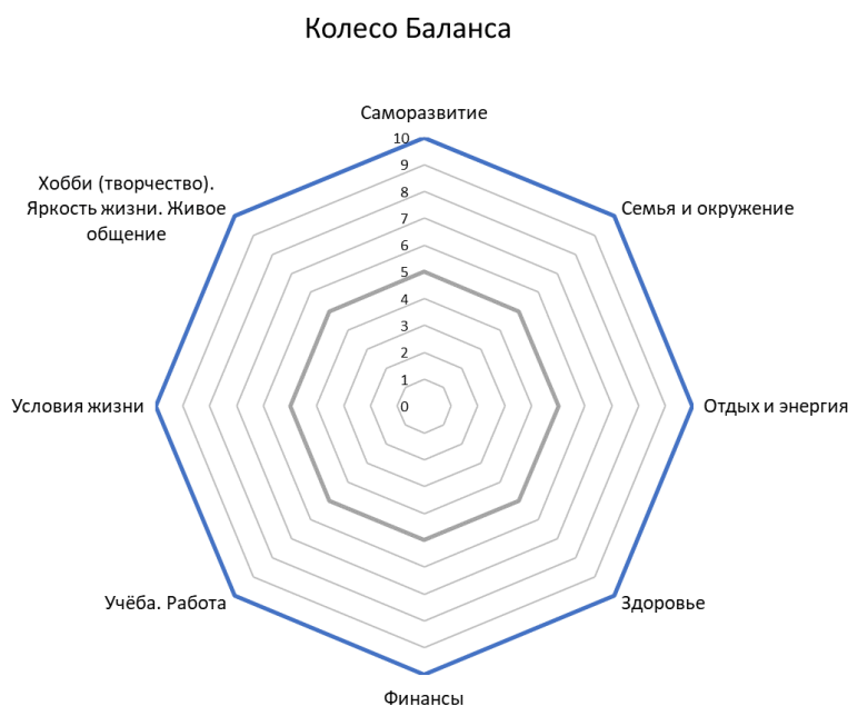
Рис. 1. Шаблон колеса баланса для студента

«Колесо баланса» формирует упрощенную, но вместе с тем очень полезную картину жизненной ситуации конкретного человека. Этот метод, несмотря на свою простоту, эффективно помогает определить уязвимые места в жизни, наметить приоритеты, цели и жизненные планы.